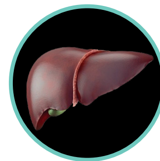
печень здорового человека

• Под воздействием алкоголя страдает работа желудочно-кишечного тракта , что приводит к таким заболеваниям, как язвенная болезнь, воспаление поджелудочной железы (панкреатит), сахарный диабет и др.