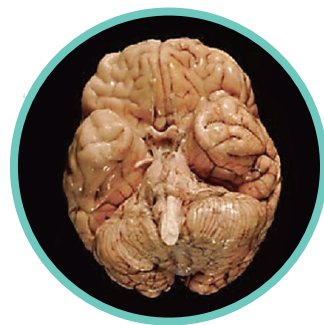
мозг здорового человека